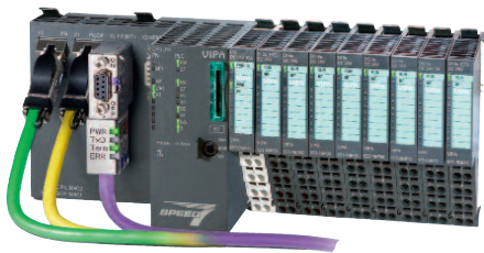
Рис. 2. Программируемый контроллер на базе CPU 015

твоей конфигурации. Конечно, возможно и комбинирование функций расширения памяти и выбора сетевого интерфейса. При положительном решении для заказа процессорного модуля ему надо определить и указать два номера для заказа, а именно базового процессорного модуля и соответствующей карты VSC. Конечно, если пользователю вполне достаточно тех возможностей, которые обеспечиваются базовой конфигурацией процессорного модуля, то ему нет необходимости заказывать дополнительную карту VSC.