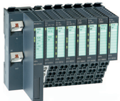
Рис. 1. Станция распределённого ввода-вывода SLIO для сети PROFINET

Подобно другим аналогичным системам, SLIO (рис. 1) состоит из интерфейсных модулей, выполняющих роль пассивного контроллера узла одной из промышленных сетей, терминальных модулей с клеммными соединителями и съёмных электронных модулей, к которым относятся сигнальные и функциональные модули, а также и модули питания. Интерфейсные модули позволяют интегрировать систему SLIO в семь наиболее распространённых про-