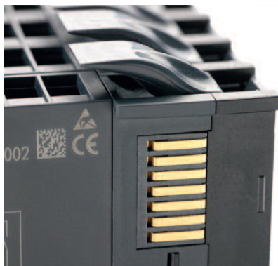
Рис. 4. Соединитель системной шины SLIO Bus