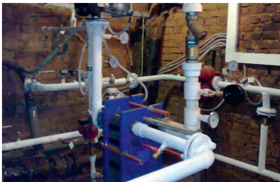
Рис. 2. Индивидуальный тепловой пункт

Главной отличительной особенностью проекта является реализация уровня диспетчерского управления на базе программного обеспечения DESIGO INSIGHT. Применение этого продукта открывает широкие возможности по дальнейшему развитию разработанной системы, связанные с присоединением локальных систем управления инженерными системами зданий. Удобный и доступный интерфейс позволяет анализировать работу полевого оборудования и системы управления, а также оперативно управлять режимами установки. Для оценки ситуации не требуется выезд ремонтной бригады на объект, все решения по управлению режимами работы оборудования принимает диспетчер. Персонал, осуществляющий сервисное обслуживание, высвобождается от значительной части