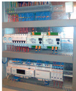
Рис. 3. Щит управления ИТП