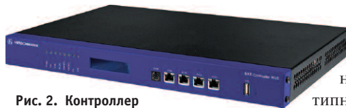
Рис. 2. Контроллер беспроводных сетей Hirschmann BAT-Controller WLC

WLAN-контроллер может управлять различными типами оборудования. Тем не менее профили оборудования, содержащиеся в его памяти, могут не совпадать со всеми возможными разновидностями точек доступа. Например, во многих