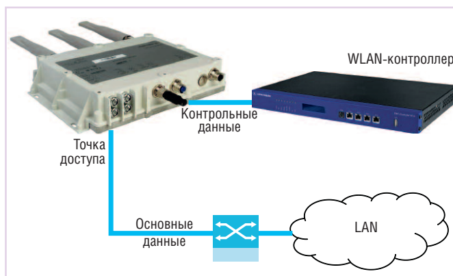
Рис. 1. Структура WLAN-контроллера