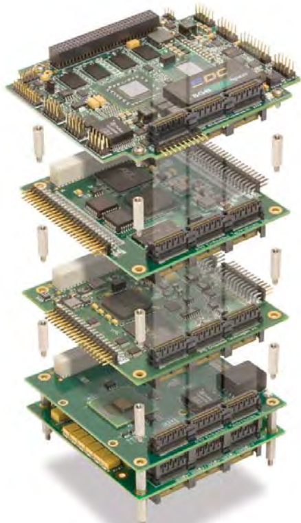
Рис. 5. Платы в формате PCI/104-Express

лий в этом перечне являются модули серии CNM3xx и источник PS351. Модули серии CNM3xx (рис. 2) – коммуникационные модули с поддержкой систем глобального позиционирования GPS и ГЛОНАСС и со встроенным модулем беспроводной связи, обеспечивающим передачу голосовых сигналов стандарта GSM для четырёх частотных диапазонов 850/900/1800/1900 МГц и передачу данных по протоколам GPRS/EDGE с поддержкой двух SIM-карт. Источник питания PS351 (рис. 3) интересен тем, что имеет интеллектуальную систему управления, выполняющую следующие функции: