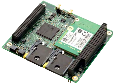
Рис. 2. Коммуникационный модуль FASTWEL серии CNM3xx с поддержкой ГЛОНАСС

жёстких условий эксплуатации, микропроцессоры и память питаются на платы, а платы рассчитаны на работу в широком температурном диапазоне от -40 до +85 °С. Таким образом, продукцию этих компаний можно рекомендовать для разработки надёжных систем управления, отвечающих условиям и требованиям ответственных применений.