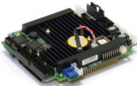
Рис. 1. Процессорная плата FASTWEL CPC304 с диапазоном рабочих температур от -50 до +85 °С

Сейчас в мире много производителей изделий стандарта PC/104, они предлагают большой выбор плат и решений. Описать их все в рамках одной статьи не представляется возможным. В качестве примера рассмотрим продукцию компаний FASTWEL , RTD Embedded Technologies , LiPPERT Embedded Computers , Tri-M Engineering , так как именно эти компании занимают активную позицию и играют ведущую роль в консорциуме PC/104 и предлагают много новых, интересных и во многом уникальных изделий и решений. Продукция этих компаний изначально разрабатывается для