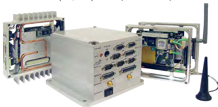
Рис. 6. Защищённый компьютер IDAN™

IDAN™ – стандартная готовая система, основанная на применении плат формата PC/104, PC/104-Plus и PCI-104, смонтированных в алюминиевом каркасе (рис. 6). Подключения осуществляются стандартными компьютерными разъёмами, установленными на каркасе. В соответствии со стандартным подходом к построению систем на базе плат формата PC/104 все необходимые платы – процессорная, ввода-вывода, коммуникационные и источник питания – собираются в мезонин; далее этот мезонин помещается в корпус, где надо будет произвести кабельную разводку, рассчитать тепловые параметры и т.д. Главный недостаток такого решения – это сложность при модернизации и обслуживании системы. В отличие от стандартного подхода, для построения систем IDAN используется другое решение: каждая плата, входящая в линейку продукции RTD, помещается в специально рассчитанный для неё фрезерованный алюминиевый каркас, форма каркаса рассчитывается из соображений обеспечения максимально эффективного теплоотвода и минимизации кабельной разводки – таким образом получаем «кирпичики», на базе которых и собирается система. При таком подходе система легко и быстро собирается и разбирается, что ускоряет и облегчает процесс технического