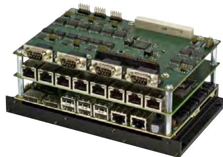
Рис. 9. Процессорная плата Hurricane-QM57 с установленными платами расширения

Канадская компания Tri-M в основном специализируется на разработке и производстве корпусов и источников питания в форм-факторах стандарта PC/104. В частности, она предлагает широкий выбор источников питания в форматах PC/104 и PC/104-Plus с функцией контроля и зарядки аккумуляторных батарей. Наиболее интересным новым решением является линейка батарей CBP (рис. 10). Они выполнены с применением конденсаторов, позволяющих получать суммарную ёмкость 10, 58, 250 и 500 фарад. Чем такое решение лучше по сравнению с использованием стандартных химических аккумуляторов? Во-первых, у конденсаторов бата-