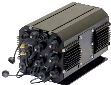
Рис. 4. Модульный защищённый компьютер FASTWEL MK307