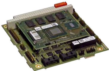
Рис. 7. Процессорная плата Cool LiteRunner-ECO