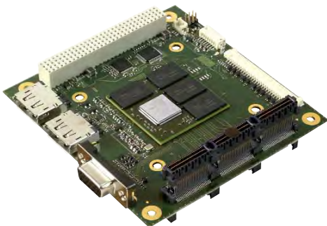
Рис. 8. Плата видеоадаптера 104X-E4690, выполненная в форм-факторе PCI/104-Express

обслуживания и модернизации системы. Использование современных процессоров позволяет строить производительные системы, но при этом остро встаёт вопрос об отводе выделяемого процессором тепла. В системах IDAN применена кондуктивная система охлаждения, когда тепло с помощью медных трубок отводится на корпус. Это позволяет получать высоконадёжные и производительные системы, работающие в широком диапазоне температур от -40 до +85^{\circ}\text{C} .