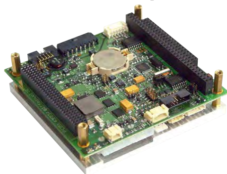
Рис. 3. Источник питания FASTWEL PS351 с интеллектуальной системой управления

Линейку продукции FASTWEL дополняют модули дискретного ввода-вывода DIC311 и DIC310, модули обработки графической информации VIM301, модули беспроводной связи серии CNM3xx, модули полевых шин NIM351 и источники питания PS351. Новыми и одними из наиболее интересных изде-