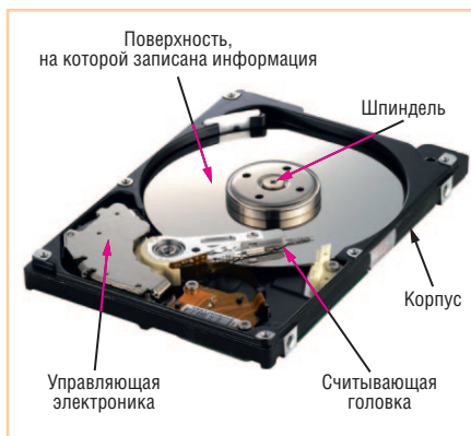
Рис 1. Конструкция НЖМД (со снятой крышкой)

Но, к сожалению, базовая конструкция и принцип работы НЖМД (магнитная головка, располагающаяся на сверх-