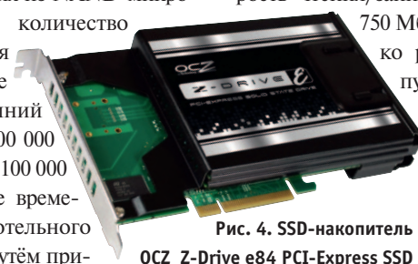
Рис. 4. SSD-накопитель OCZ Z-Drive e84 PCI-Express SSD

SSD-накопители поставляются не только с интерфейсом Serial ATA как замена традиционного жёсткого диска, но и как платы расширения для компьютеров, оснащённых шиной PCI Express, например, изделие Z-Drive e84 PCI-Express SSD производства компании OCZ (рис. 4). В таком устройстве объединены производительный многоканальный контроллер флэш SLC-памяти и высокоскоростная шина передачи данных. Устройство имеет 2 варианта исполнения: ёмкостью 256 или 512 Гбайт. Скорость чтения/записи составляет 800 и 750 Мбайс/с, что в несколько раз превышает пропускную способность интерфейса SATA, которая в случае применения SSD является потенциальным «бутылочным горлышком».