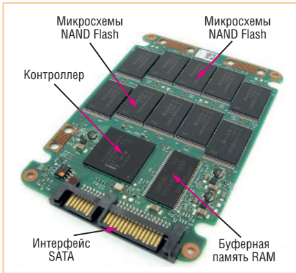
Рис. 2. Конструкция твердотельного накопителя Intel X25-M

В настоящее время как альтернатива винчестерам набирают популярность устройства на основе твердотельной памяти (Solid State Drive – SSD) – энергонезависимые накопители без движущихся частей (рис. 2). Первые устройства флэш-памяти (flash) на основе NAND-технологии были представлены в середине 90-х годов прошлого века компанией M-Systems. Они имели форм-фактор 3,5" или 2,5". К сожалению, их стоимость