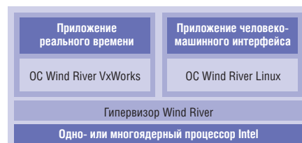
Рис. 1. Виртуализация вычислений

По мере роста сложности регулирующие органы выпускают всё больше формальных методов и процессов сертифици-