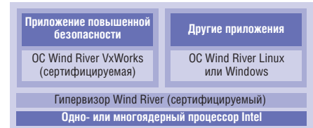
Рис. 4. Виртуализация в приложениях с повышенными требованиями к безопасности