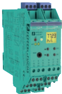
Рис. 2. Внешний вид конструкции HART-преобразователя контура KFD2-HLC-Ex1.D.2W

Интересным аспектом является то, что HLC предоставляет доступ к дополнительным функциям HART-совместимых полевых приборов для мониторинга и управления производственными процессами без прокладки новых проводов и без необходимости вмешиваться любым другим способом в существующую коммуникационную