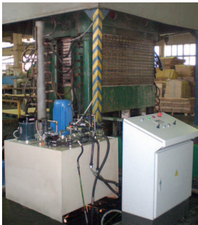
Рис. 1. Пресс фанерный П-714Б (идёт цикл прессования)

манометров был установлен датчик давления, имеющий аналоговый выходной сигнал 4...20 мА, уставки времени стали задаваться на панели оператора. Теперь вместо опасного для обслуживающего персонала напряжения 220 В катушки гидрораспределителей управляются сигналами 24 В постоянного тока, что явилось дополнительной мерой электробезопасности, а разъёмы на гидрораспределителях имеют светодиодную индикацию включённого состояния, что очень удобно при проведении пусконаладочных работ и, несомненно, будет оценено ремонтным персоналом в случае возникновения каких-либо неисправностей.