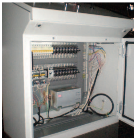
Рис. 4. Электрооборудование системы, установленное на монтажной панели пульта

В описываемом проекте нужны были прочные, красивые кнопки, выдерживающие плохое настроение оператора и его тяжёлую руку. К сожалению, таких