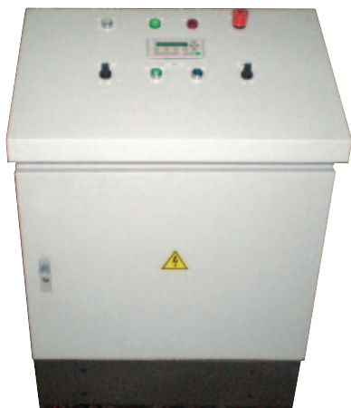
Рис. 3. Внешний вид пульта управления прессом П-714Б

внутри из ассортимента продукции этой фирмы позволил разместить не только все необходимые органы управления (которых, кстати сказать, было совсем немного) на откидывающуюся крышку пульта, но и всё остальное электрооборудование вместе с контроллером на монтажную панель. Что у нас вышло, можно посмотреть на рис. 3 и 4.