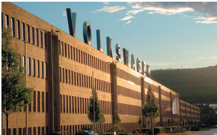
Завод в Касселе является вторым по значимости производством Volkswagen в Германии

Производственная линия, включающая в себя 14 роботизированных рабочих мест, 4 сегмента транспортной системы, рельсовые поворотные станции