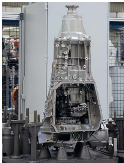
Коробка передач на установочной плите

Фирменная технология SPEED7 предоставляет в распоряжение пользователя практически неограниченную производительность. Возможность гибкого управления памятью в наивысшей степени отвечает требованиям пользователей. Объем памяти контроллера может изменяться в процессе эксплуатации в соответствии с требованиями задачи/приложения, позволяя обойтись без замены уже существующего аппаратного