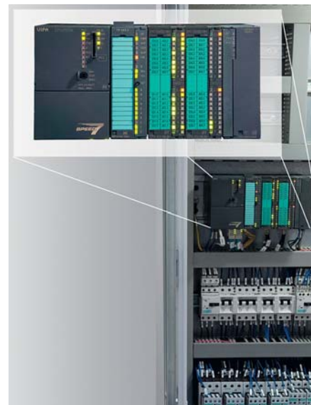
Минимальное время цикла работы программы и большой объем памяти стали решающими факторами для применения ПЛК VIPA на заводе Volkswagen в Касселе

Тридцать семь ПЛК, установленных на сборочной линии, связаны в единую