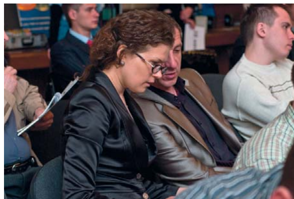
Для специалистов в области АСУ ТП и встраиваемых систем «День решений ПРОСОФТ» — всегда возможность узнать что-то новое и обсудить с коллегами

Семинар продемонстрировал готовность компании ПРОСОФТ предложить отечественным разработчикам и системным интеграторам полный набор современных технологий и продукции для быстрой реализации проектов АСУ ТП в любых отраслях. ●