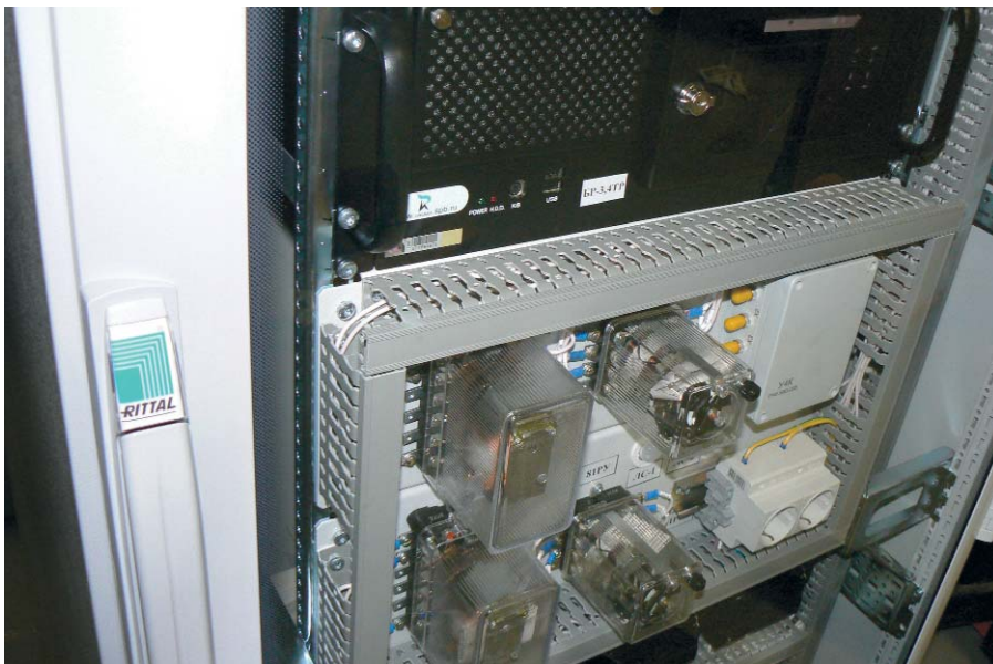
Рис. 2. Шкаф Rittal с цифровым регистратором аварийных процессов «Парма» для Смоленской АЭС

лекса СК-2007. ОИК обеспечивает опрос измерительных приборов и контроллеров по протоколу Modbus, обработку информации, её отображение на компьютерах АРМ пользователей и передачу в удалённые центры управления по протоколу МЭК 60870-5-104.