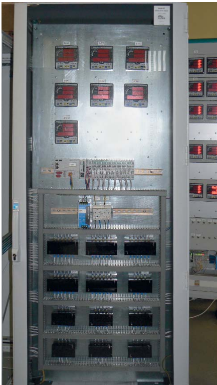
Рис. 4. Шкаф Rittal с датчиками телеизмерений SATES и контроллерами WAGO I/O для Ленинградской АЭС

новку их в линейку, причём такое расположение никак не влияет на удобство монтажа и пространство для прокладки кабеля. Хочется также отметить наличие системы контроля микроклимата, благодаря которой обеспечивается охлаждение чувствительной электроники в шкафах, серверов и сетевого оборудования системы. Эти шкафы также обеспечивают высокую доступность при монтаже и обслуживании оборудования. Максимально изменяемая и надёжная конструкция стойки сочетается с наличием пяти встроенных систем: энергоснабжения, охлаждения, безопасности, контроля шкафов и дистанционного управления.