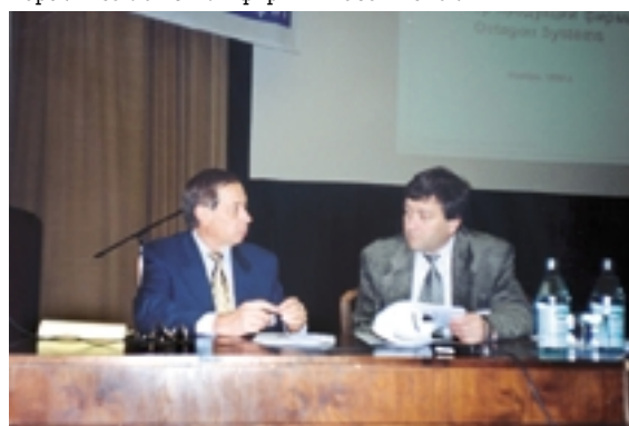
Octagon Systems и ПРОСОФТ — братья навек

признанными лидерами рынка оборудования и компонентов для АСУ ТП, как Siemens, Omron, Hirschman и Vorla. Изделия всех новых поставщиков, появившихся в программе поставок ПРОСОФТ этим летом, нашли отражение в очередном 4-м выпуске 192-страничного каталога ПРОСОФТ, который получили все участники семинара. С докладами о предлагаемом фирмой ПРОСОФТ оборудовании и программном обеспечении, а также о перспективах развития техники для жестких условий промышленной эксплуатации выступили: