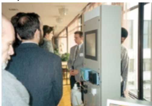
Во время семинара работала мини-выставка оборудования ПРОСОФТ