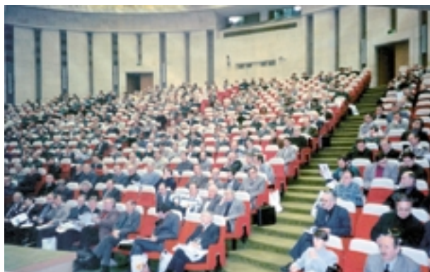
В семинаре приняло участие около 600 технических специалистов

10 ноября компания ПРОСОФТ провела свой традиционный осенний семинар для специалистов в области АСУ ТП. Семинар посетили представители 320 предприятий (всего около 600 специалистов, в основном из различных регионов России, Казахстана, Украины и Белоруссии).