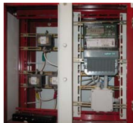
Рис. 3. Счётчик потребления электрической энергии лифтами и системой освещения

В ЕДЦ установлены серверы опроса и сервер базы данных (рис. 4). Все серверы базируются на платформе Fastwel AdvantiX и работают под управлением операционной системы MS Windows. К серверу базы данных подключаются автоматизированные рабочие места (АРМ). Основное рабочее место оператора АСКК расположено в едином диспетчерском центре. На данный момент