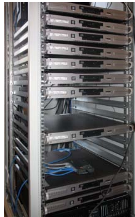
Рис. 4. Стойка серверов Fastwel AdvantiX, установленная в ЕДЦ (этап монтажа стойки)

Кроме системы АСКК, в городе разворачивается система видеонаблюдения и организован call-центр «Горячая линия». Все эти системы сосредоточены в ЕДЦ.