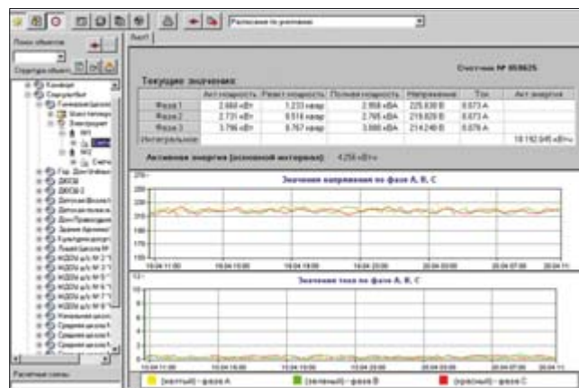
Рис. 5. Экранная форма (мнемосхема) для просмотра текущих значений потребления электрической энергии

Автор — сотрудник фирмы ПРОСОФТ Телефон: (495) 234-0636 E-mail: karpov.v@prosoft.ru