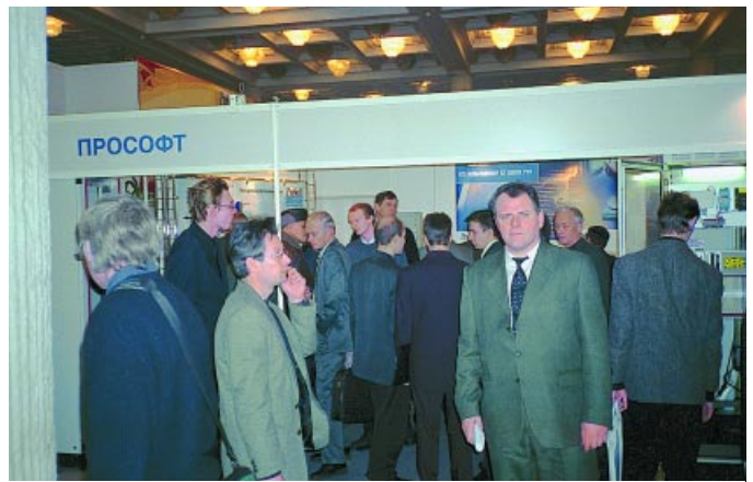
Проходившая во время семинара выставка вызвала большой интерес среди специалистов