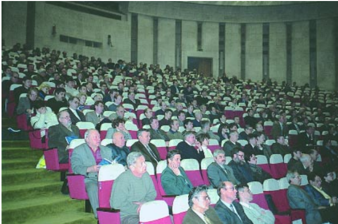
В семинаре и выставке приняли участие около 2000 специалистов из России и ближнего зарубежья