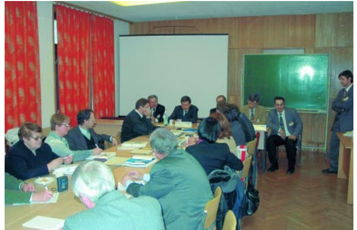
Фирма ПРОСОФТ провела пресс-конференцию для представителей российских средств массовой информации