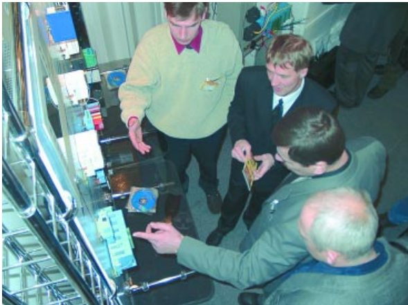
Посетители выставки могли ознакомиться с последними новинками аппаратных и программных средств для систем автоматизации

Одно из главных достоинств проходившей во время семинара выставки заключалось в ее намеренно узкой специализации и высоком уровне квалификации абсолютно всех ее посетителей, приехавших в Москву из различных регионов России и ближнего зарубежья. Рассчитанное на специалистов,