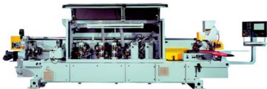
Рис. 2. Автоматизация законченной машины на базе модульной структуры стандартных компонентов

Главное требование состоит в том, что инженеры, специализирующиеся на отдельных системах, должны понимать код программ, разработанных для каждого уровня. Конечно, это возможно, только если описанные ранее концепции проектирования соблюдаются для всех уровней и являются аппаратно независимыми. Для обеспечения переносимости кода инструмент программирования должен поддерживать различные аппаратные архитектуры. Это