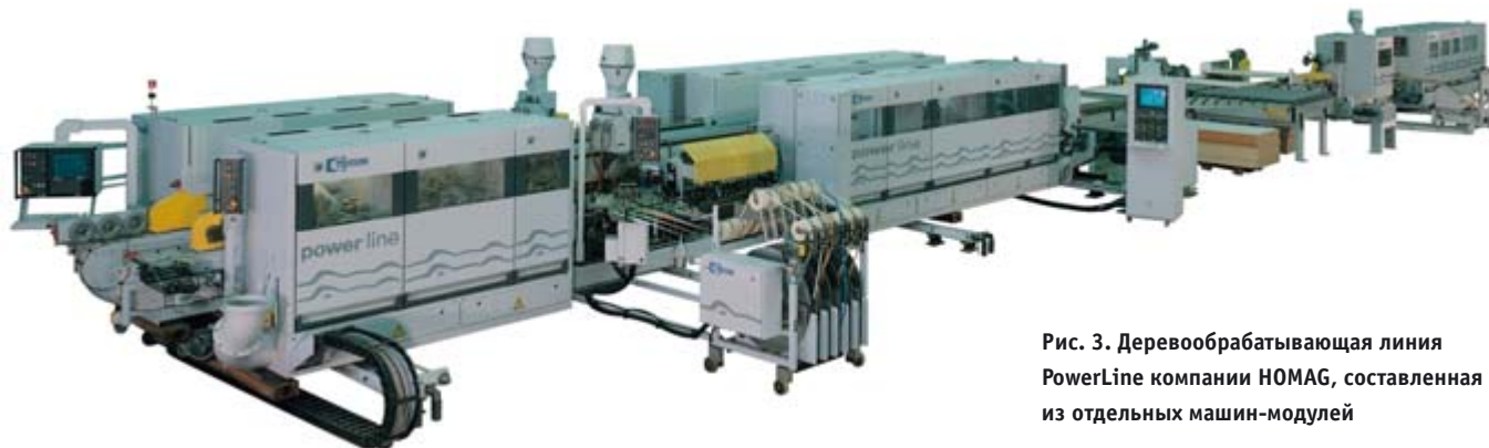
Рис. 3. Деревообрабатывающая линия PowerLine компании HOMAG, составленная из отдельных машин-модулей

означает, что для полного использования возможностей каждого типа процессоров система программирования должна иметь компиляторы для каждого из них. Сверх того, она должна обеспечить использование сильнейших сторон процессоров без изменения прикладной программы. Естественно, все программируемые контроллеры должны иметь единый механизм обмена данными, чтобы инженер по приложениям мог свободно обращаться к данным других уровней по сети.