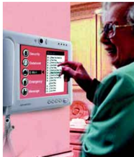
Рис. 3. Панельный компьютер фирмы Advantech в системе «умный дом»

Автор — сотрудник фирмы ПРОСОФТ 119313 Москва, а/я 81 Телефон: (095) 234-0636 Факс: (095) 234-0640 E-mail: info@prosoft.ru