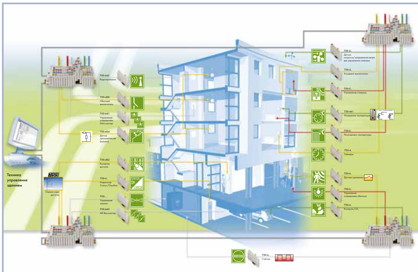
Рис. 2. Система автоматизации здания с использованием ПЛК WAGO I/O серии 750

личных технических решений, но многолетний опыт применения системы WAGO I/O серии 750 в Европе позволяет говорить о ней как об общепринятом решении для интеллектуального здания.