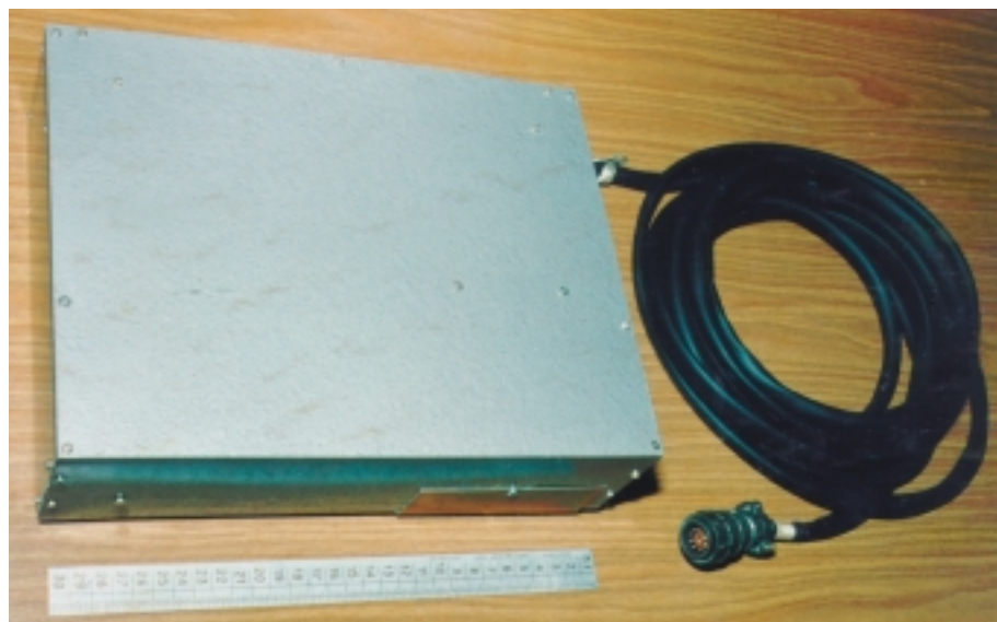
Рис. 3. Бортовой регистратор перед установкой в локомотив