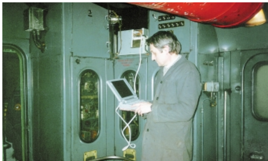
Рис. 4. Считывание информации из регистратора

Функциональные возможности базового варианта несложно наращивать за счет подключения имеющихся в серии MicroPC модулей ввода аналоговых и дискретных сигналов, модулей для измерения временных параметров сигналов, модулей энергонезависимой памяти, сетевых адаптеров для интегрирования БР в локомотивные информационно-управляющие системы.