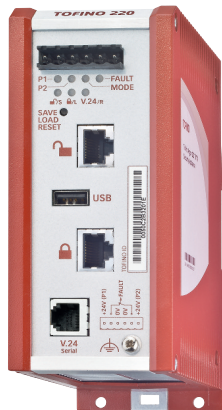
Рис. 1. Программно-аппаратный комплекс Hirschmann Eagle TOFINO для обеспечения кибербезопасности в промышленных сетях