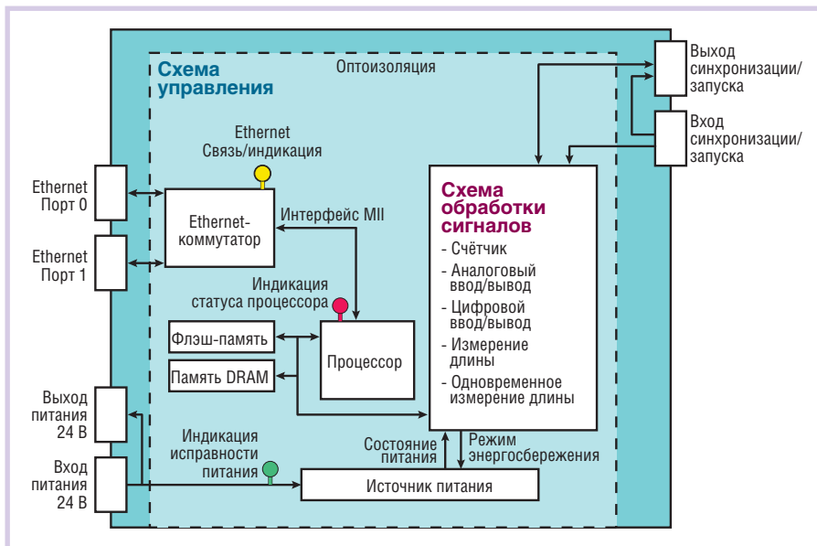
Рис. 2. Структурная схема интеллектуального Ethernet-модуля, реализующего коммуникационные функции, а также ввод-вывод и обработку сигналов

предполагает, что измерения запускаются контроллером, после чего модуль ввода-вывода передаёт полученные значения в ПЛК.