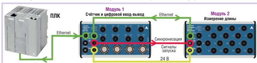
Рис. 3. Объединение двух интеллектуальных Ethernet-модулей MSX-E1701 и MSX-E3701 (фирма ADDI-DATA) для снижения нагрузки на ПЛК и организации приёма данных от энкодера

номера последовательностей измерений и т.д., а также установить порядок использования сигналов запуска.