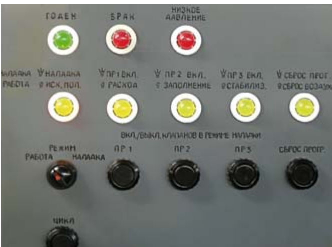
Рис. 4. Пульт управления

Авторы — сотрудники ОАО «ГАЗ» Телефон: (8312) 90-8917