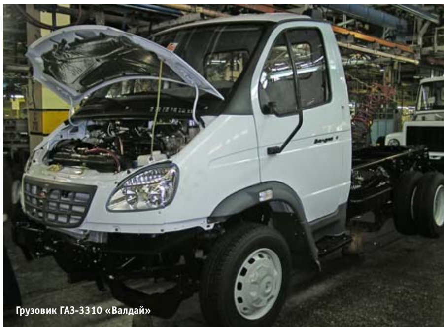
Грузовик ГАЗ-3310 «Валдай»

Сжатый воздух давлением 0,40 МПа поступает на вход пневмораспределителя