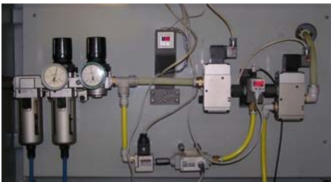
Рис. 5. Пневмооборудование стенда