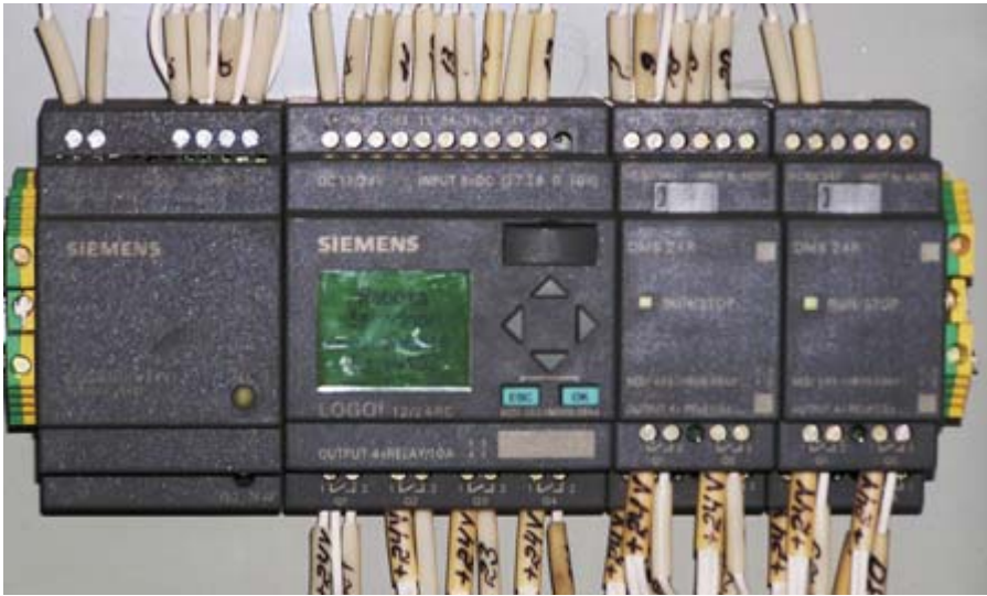
Рис. 3. Программируемый логический контроллер LOGO! из состава системы управления стендом