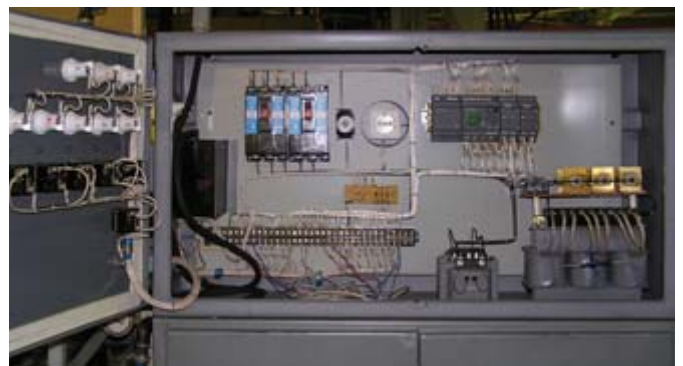
Рис. 6. Электрооборудование стенда